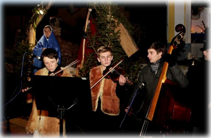
* Zpívání vánočních koled u kapličky panny Marie / Singing Christmas carols near virgin Maria 's Chapel