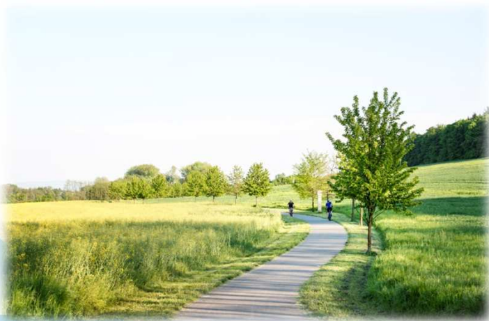
* Cyklostezka / Cycling path