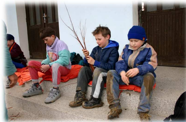
* Pletení pomlázky / Braiding the traditional pussy-willow whips