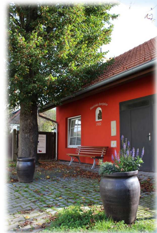
nyní / nowadays