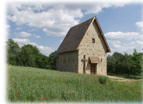
Kostel v r. 2013 / Church in 2013