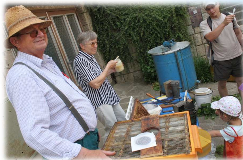
* Včelaři / Beekeepers