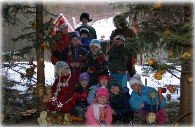
* Zdobení vánočního stromku pro zvířata / Christmas tree decorated for forest animals