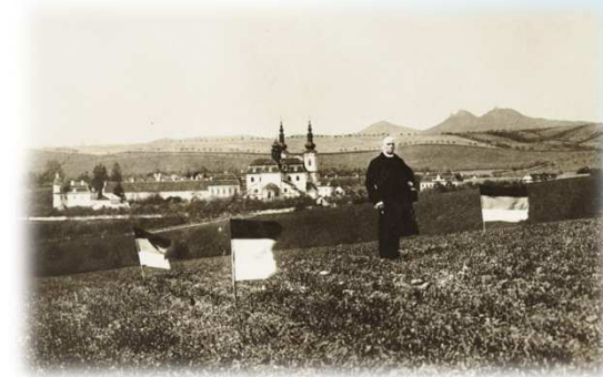
Nález základů kostelíka v r.1911 / Finding the foundations of the church in 1911