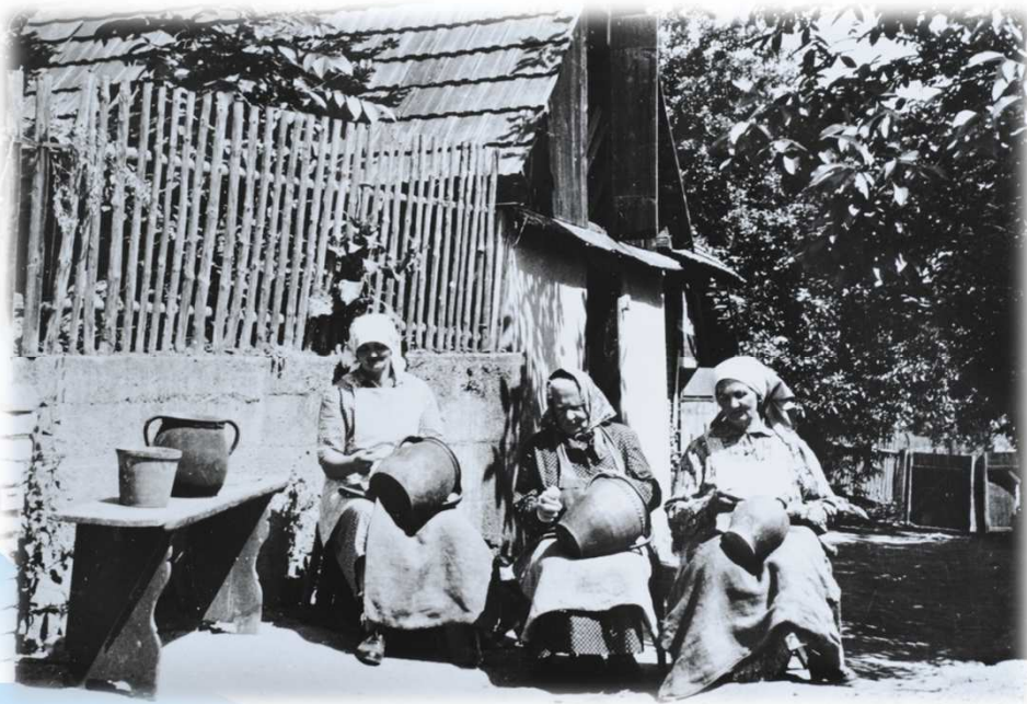
dříve / in the past

* „Zakuřovaná“ keramika / Traditional ceramics production