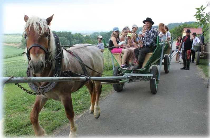
* Dětský den / Children's Day