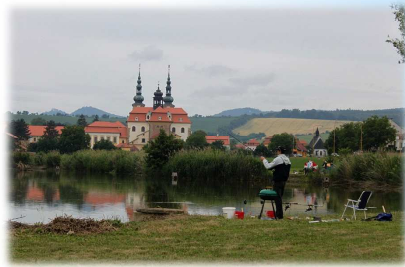
* Rybářské závody / Fishing competitions