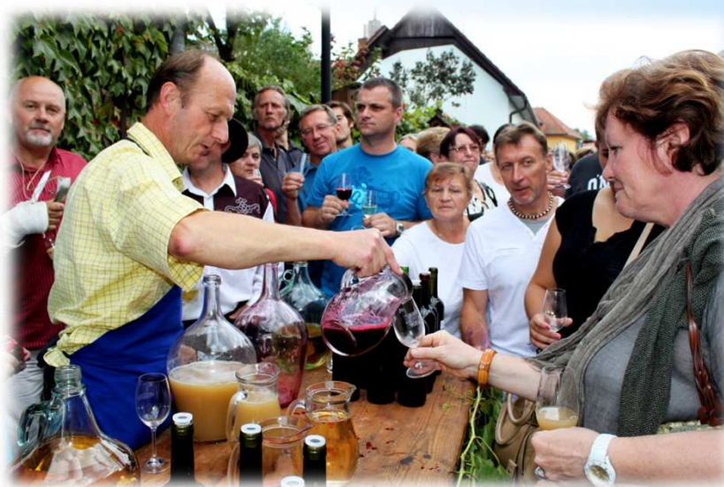
* Vinobraní - zastavení u vinaře / Vintage - stopping at vine-grower