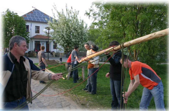
* Stavění Máje / Maypole