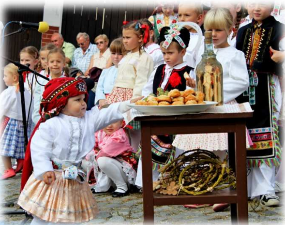
* Vinobraní - „Já chci taky kousek“ ☺ / Vintage - „ I want a piece too“