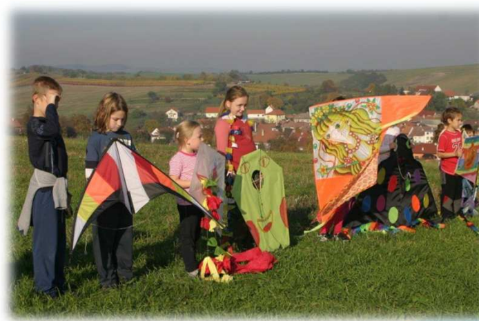
* Pouštění draka / Kiteflying