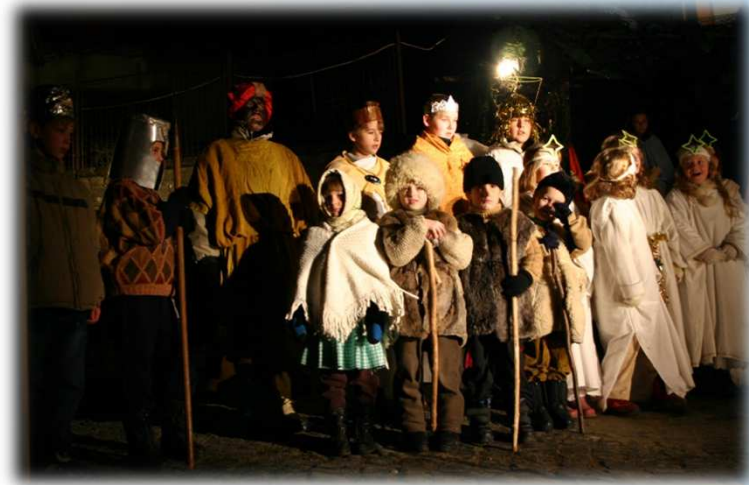
* Betlémské divadelní pásmo / Bethlehem theatrical range