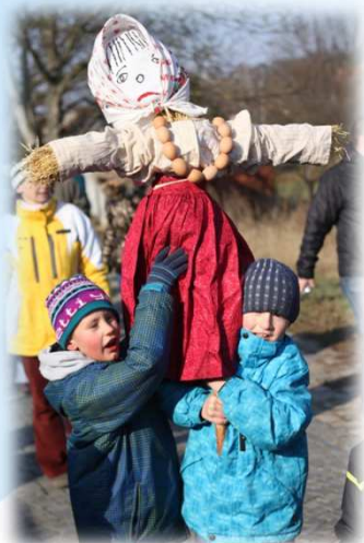
* Jarní rovnodennost - Vynášení Morany / Vernal Equinox - carry winter out of the village in the form of „Moran“