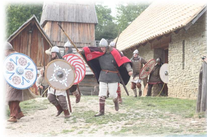
* Bitva o Veligrad / Battle of Veligrad