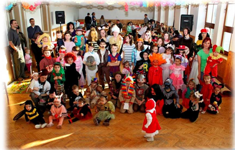
* Každoroční karneval / Annual carnival