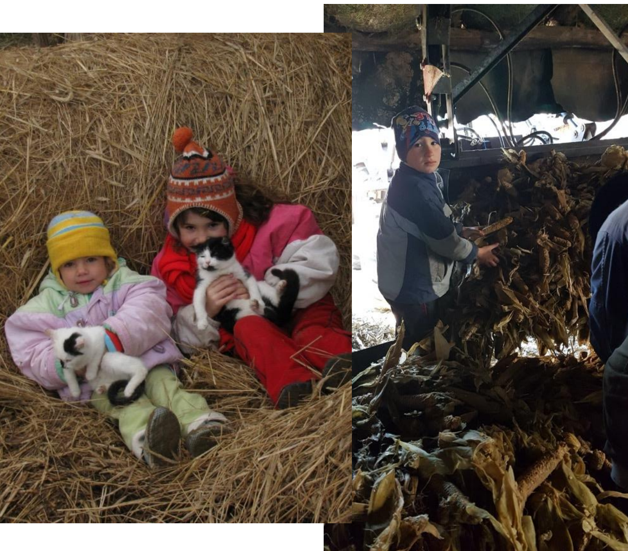
Kisgyermekként még játékként fogják fel a munkát...